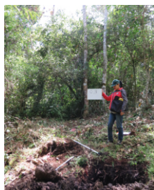
Clase alta, bosque

La regeneración natural del bosque presenta una distribución normal "J" invertida, indicándonos que el proceso sucesional se desarrolla de forma relativamente normal, pero está siendo