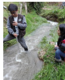
Cuerpo de agua

La Quina es la especie con mayor I.V.I de estos bosques húmedos y en conjunto con otras brindan diferentes servicios ecosistémicos (regulación hídrica); lo cual se puede evidenciar en las microcuencas, puesto que mantienen su caudal todo el año en esta zona, asegurando el régimen continuo y disponibilidad del recurso