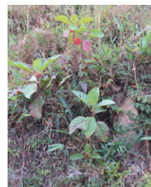
Regeneración natural, brinzales

afectada puesto que al observar el número de brinzales en función a las siguientes categorías (latizales, fustales y maduros) la disminución es considerable y de las especies encontradas no todas presentan individuos en las 4 categorías, esto debido a factores antrópicos. La Cinchona officinalis presenta el mayor I.V.I con un 45.01 %.