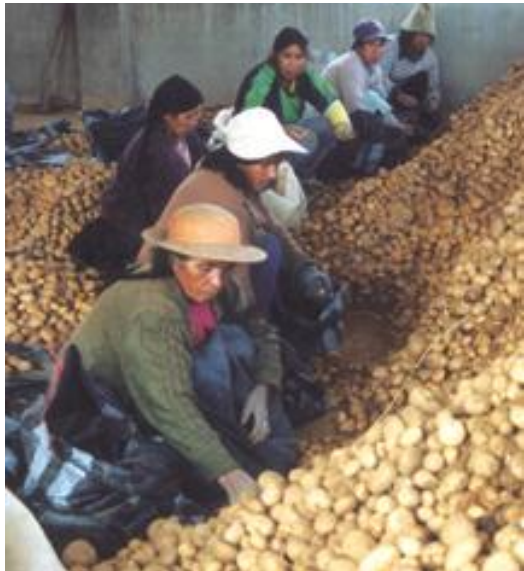
FOTO 15. Selección y clasificación de semilla de papa oportuna

La selección del tubér-culo-semilla debe realizarse inmediatamente después de la cosecha y se deben eliminar todos los que no se ajusten a las características de la variedad como: