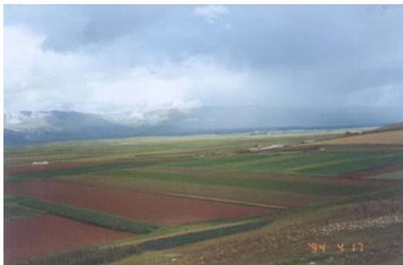
FOTO 3. Protección física: Ubicación de campos semilleros aislados.

Se refiere a la preparación adecuada del terreno; siembra de cultivos no afines a la papa que cumplan la función de barreras alrededor del semillero, limpieza de las herramientas de labranza.