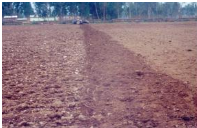
FOTO 4. Buena preparación del suelo con anticipación para la emergencia uniforme del cultivo.

La preparación del suelo desde la aradura hasta el surcado debe tener los siguientes objetivos: