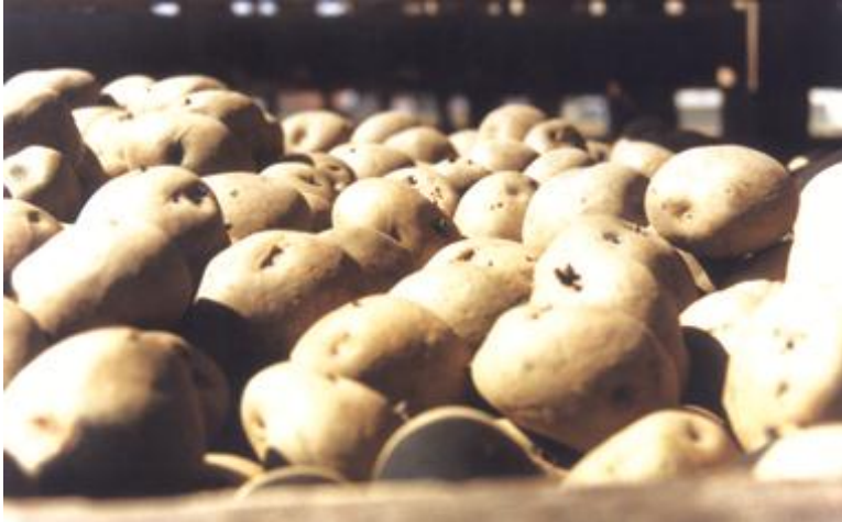
FOTO 18. Tubérculos - semilla almacenados en condiciones óptimas para la siembra.