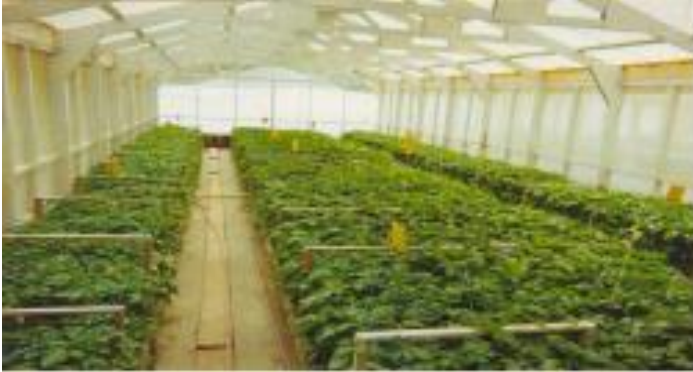
FOTO 2. Producción de semilla pre-básica de papa en invernadero

Es un principio basado en la protección o defensa de las plantas de ataques ya sean de hongos, bacterias o insectos vectores. La protección puede ser física o química.