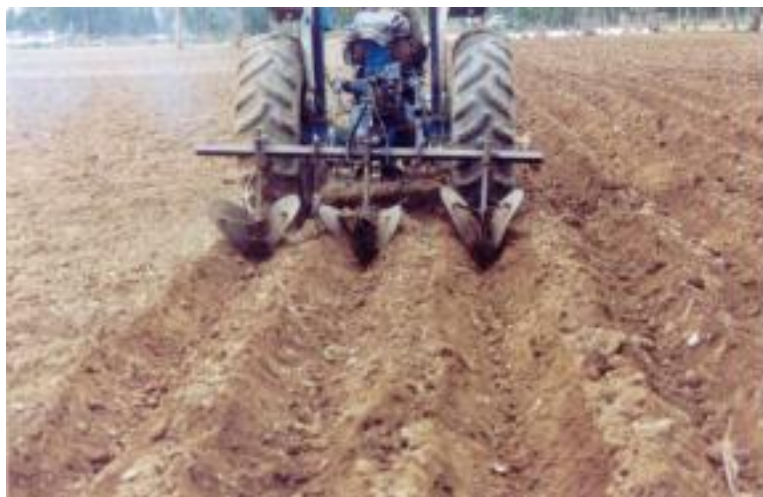
FOTO 11. Control de malezas oportuno, mecanizado

Para controlar las malezas se deben combinar métodos culturales, químicos y mecánicos.