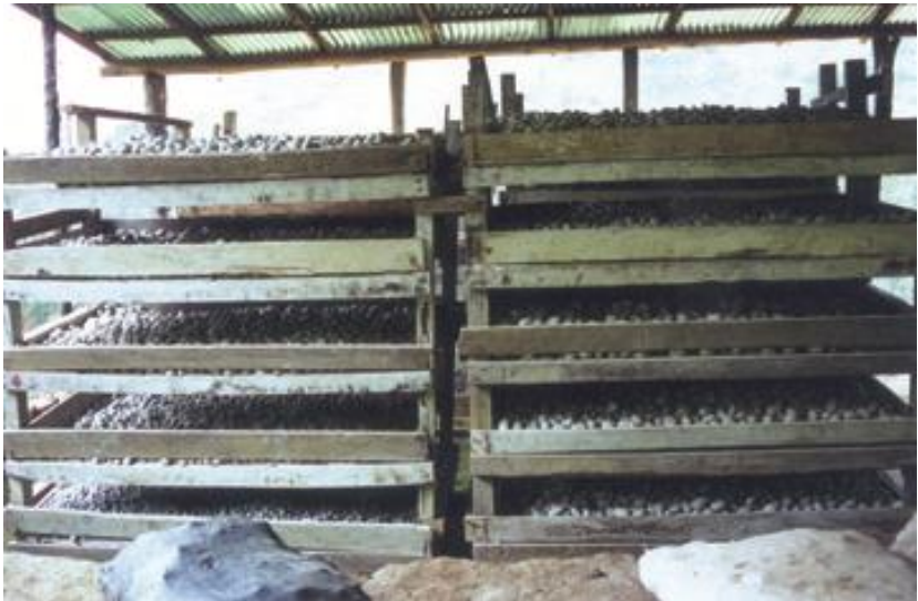
FOTO 17. Almacenamiento de tubérculo - semilla a luz difusa

Las condiciones preliminares para almacenar cualquier tubérculo de papa, ya sea por un corto o largo tiempo, son las siguientes: estar limpio, seco, sano y sin lesiones en la piel.