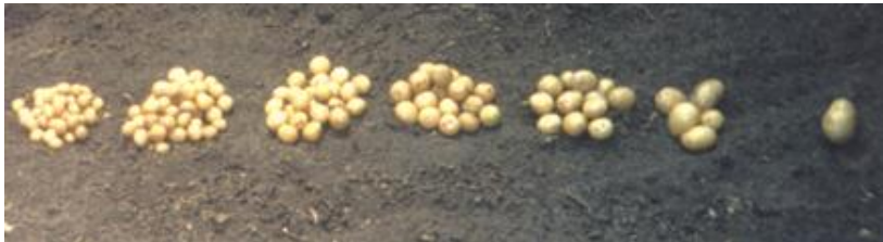
FOTO 16. Clasificación de la semilla por tamaños, es importante para la siembra o venta.

En un semillero, todas las técnicas o métodos deben estar dirigidos al logro de tubérculos - semilla de la más alta calidad sanitaria, identidad, pureza varietal y fisiológicamente aptos, que originen plantas de similares características y con gran capacidad de producción.