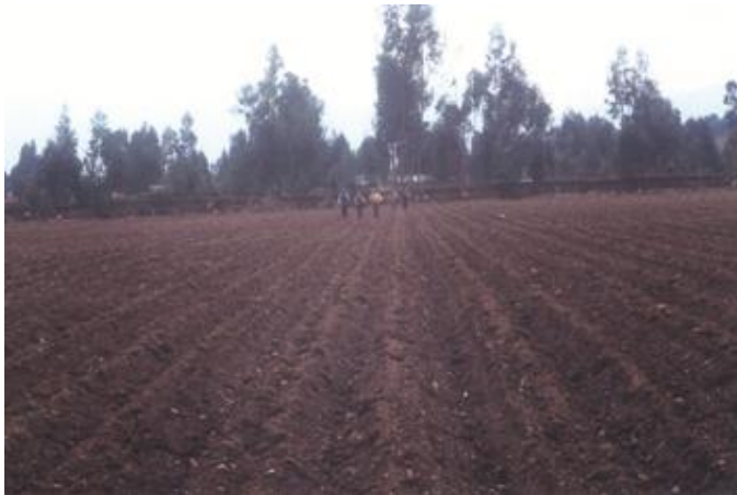
FOTO 10. Aplicación de materia orgánica para la instalación de un campo semillero de papa de alta calidad