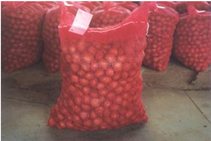
FOTO 19. Comercialización de tubérculo - semilla con Certificación y nombre, garantiza su calidad