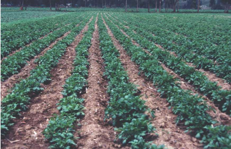
FOTO 8. Campo semillero de papa de alta calidad, la emergencia es uniforme.