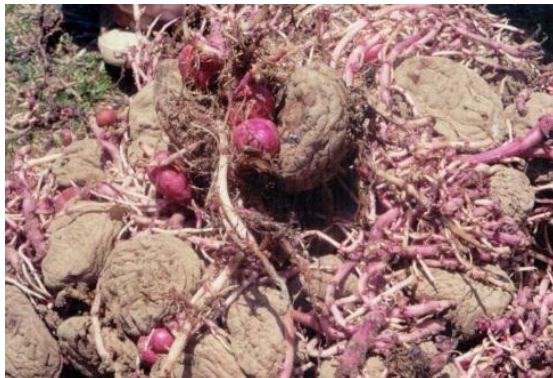
FOTO 9. Semilla de mala calidad, tubérculos viejos.