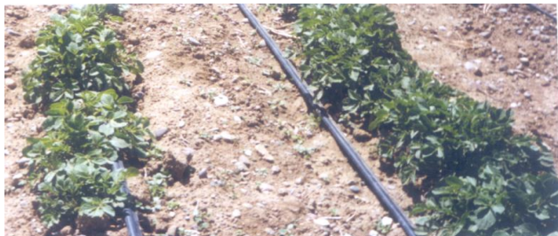
FOTO 13. Reservorio de agua para riego por goteo para asegurar la producción.