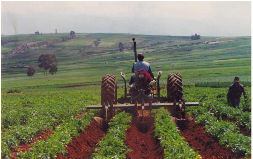
FOTO 12. Aporques altos para evitar daños de insectos y enfermedades.