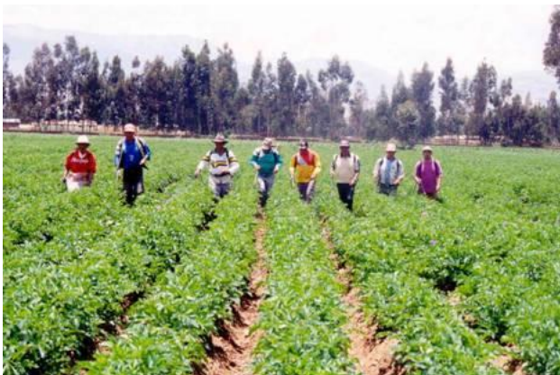
FOTO 14. Protección sanitaria de semillero de papa de alta calidad.

Para el caso de semillas de papa, la protección sanitaria es de vital importancia para la producción de semilla de calidad, y esto se debe realizar desde la pre – siembra hasta la cosecha.