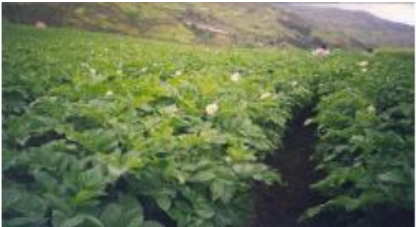
FOTO 1. Semillero de papa de alta calidad aislado de otro cultivo comercial

Los campos destinados a la producción de semilla de papa de calidad deben estar lo suficientemente aislados de otros campos de papa comercial (solanáceas o cultivos afines a la papa), con la finalidad de prevenir las invasiones de vectores de virus y de enfermedades y plagas.