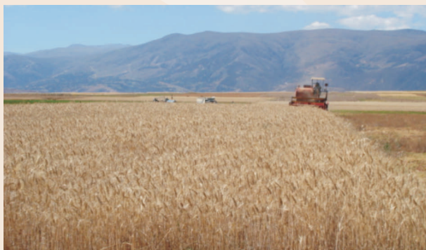
Semillero con la nueva variedad de Trigo INIA 424 - Vicseño