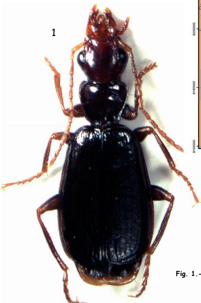
Fig. 1. - Mimodromius altus Liebke, 1941.