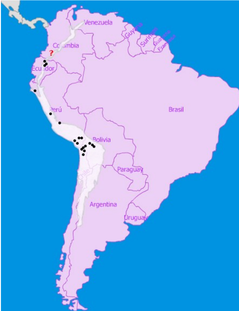
◀ Mapa 1.- Mapa de distribución conocida de O. anticola (Guérin-Méneville, 1855) en relación con la subregión Páramo-Puneña (superpuesta en blanco). Tomado de MORRONE (2001), modificado.