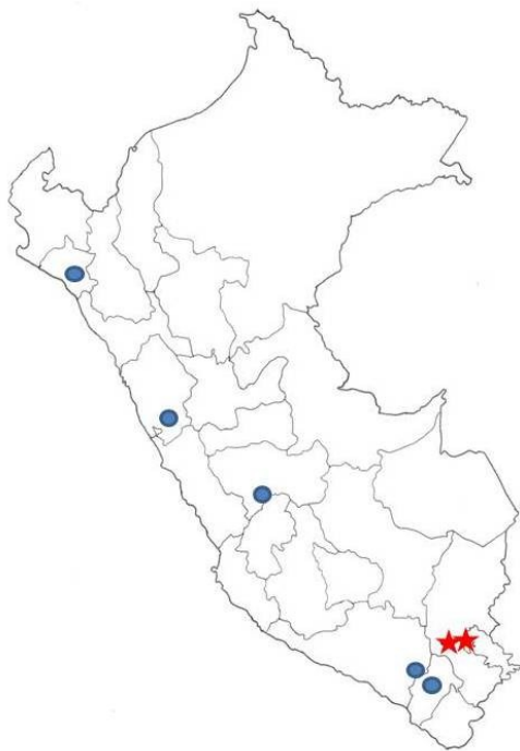
◀ Mapa 2.- Distribución conocida de O. anticola en Perú. Con círculos azules citas bibliográficas; con estrellas rojas, nuevos registros.