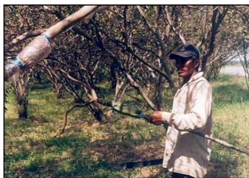
Obtención de rama acodada