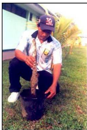
Acodo en maceta