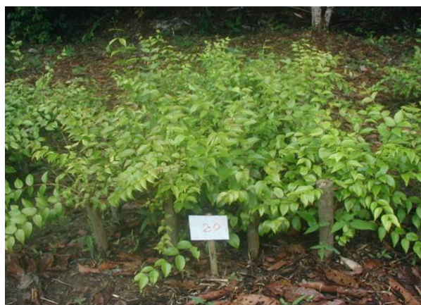
Etapa de incremento de raíces