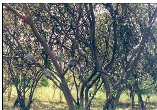
Planta madre acodada