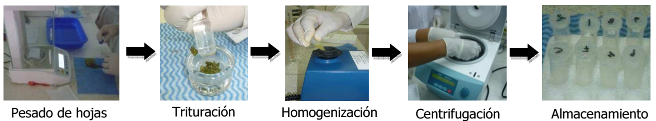
Figura 2. Proceso de extracción de vitamina C a partir de hojas de Myrciaria dubia "camu camu"

Se efectuó en base a Loeffler y Pointing (1942) modificado, que consistió en mezclar 100 µl del sobrenadante obtenido con 900 µl de 2,6-Diclorofenolindofenol 0.5mM, se homogenizó por 30 seg en el vortex y procedió a leer la absorbancia a 530 nm en un espectrofotómetro UV/Vis Genesys 6.0. El blanco de lectura empleado fue ácido oxálico al 0,4%. La cuantificación de la vitamina C se realizó en base a las ecuaciones de dos curvas estándares, una preparada en el rango de 100 a 200mg/L y la otra en el rango de 200 a 800mg/L (figura 3).