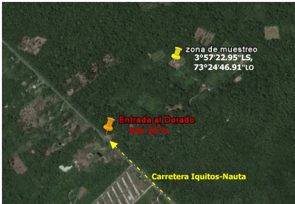
Figura 1. Ubicación de la Colección de Germoplasma de "camu camu" del INIA. Lugar donde se colectaron las hojas del "camu camu" para extraer y cuantificar la vitamina C.