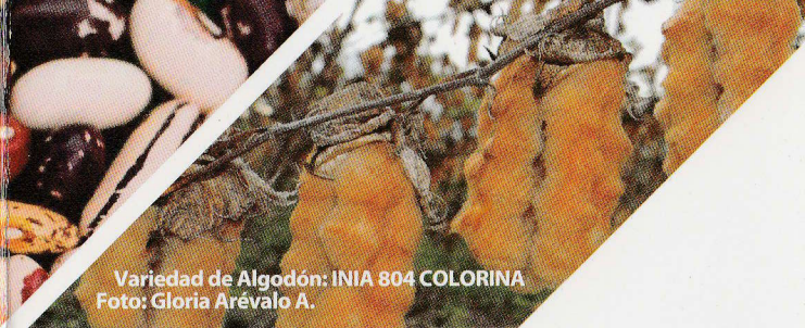
Variedad de Algodón: INIA 804 COLORINA

La Unión Internacional para la Protección de las Obtenciones Vegetales (UPOV) y el convenio UPOV tienen como misión proporcionar y fomentar un sistema eficaz para la protección de las variedades vegetales.